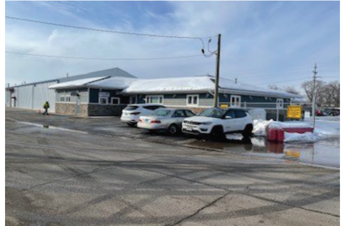
Fiber Drum 2414 and 139 th Place