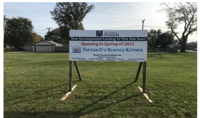
Captain D's 147 th Whipple Opening Summer 2021

Now hiring at Careers at Dunkin' Brands | Dunkin' Brands