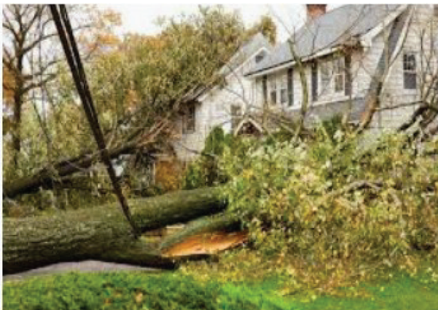
Removing Dangerous Trees