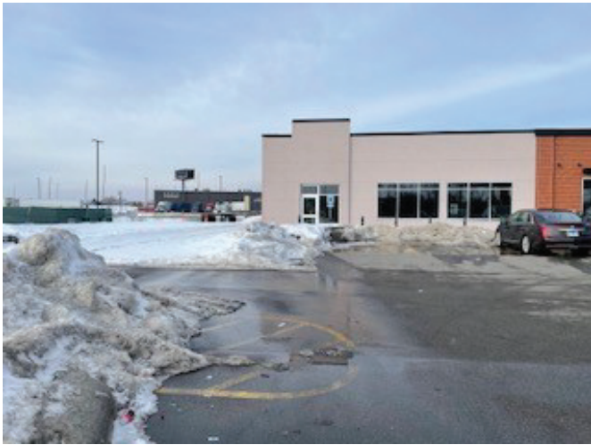
Wendy's 147 th Western West of Thortons Opening Memorial Day Weekend