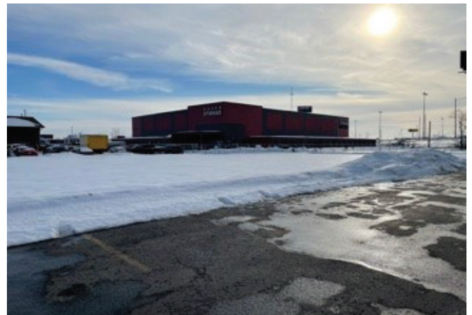
Posen Storage 14750 and Western