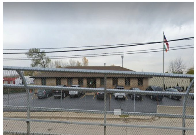
Erin Rope 2661 and 139 th Street