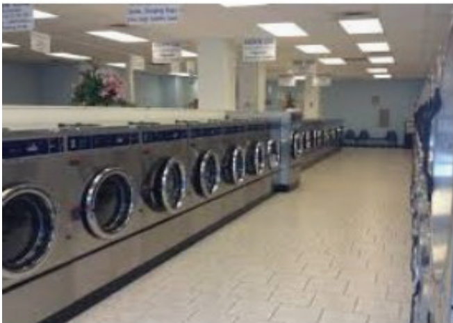
2,400 sq. ft. Laundry Facility 148 th Kedzie Breaking Ground Summer 2021