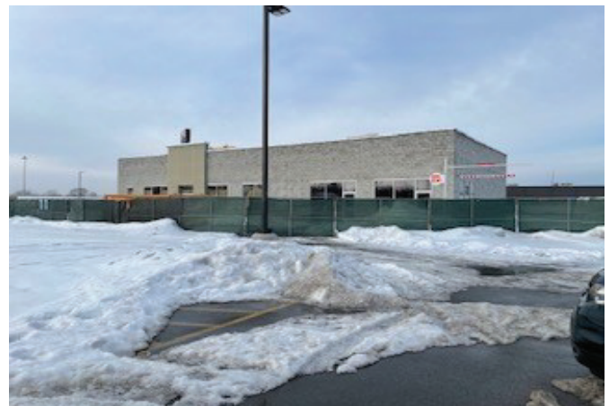
Baskin Robbins and Dunkin' Donuts 147 th Western west of Thortons Opening April 2021

Now hiring at Careers at Dunkin' Brands | Dunkin' Brands