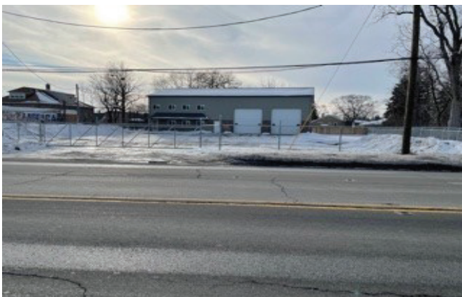
Versa Truck and Tractor Repair 2410 and 140 th