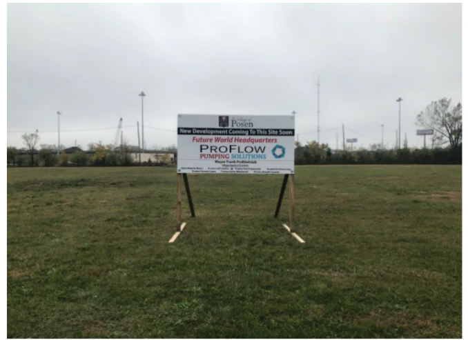
Pro Flow Walter Zimny Drive